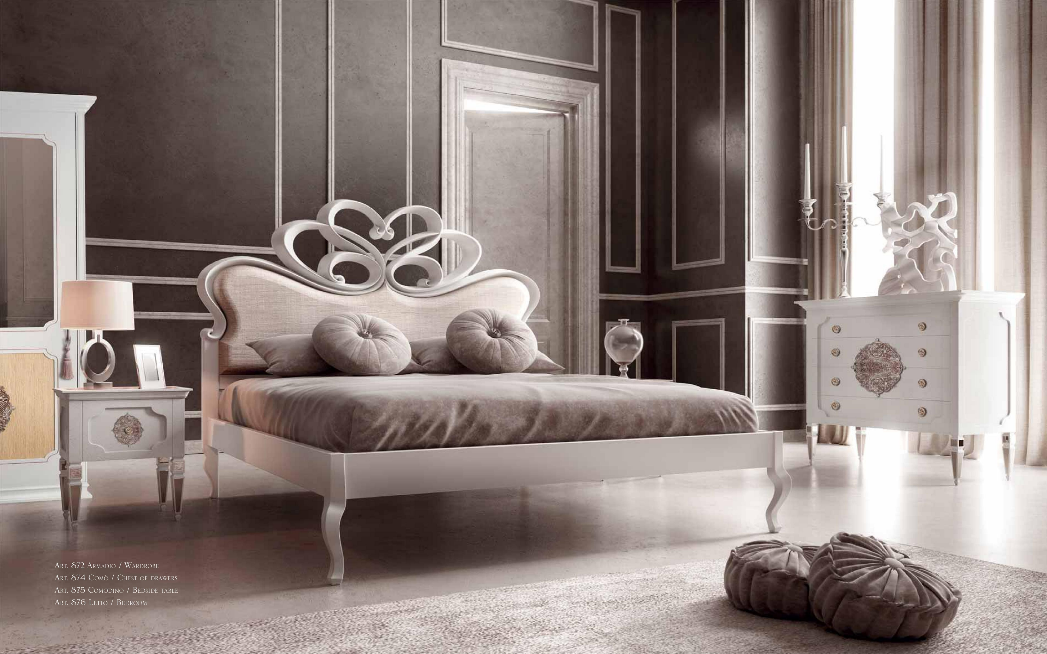
ART. 872 ARMADIO / WARDROBE ART. 874 COMÒ / CHEST OF DRAWERS ART. 875 COMODINO / BEDSIDE TABLE ART. 876 LETTO / BEDROOM

IL LETTO È IMBOTTITO CON TESTATA INTAGLIATA IN LEGNO MASSICCIO, INSERTO IN ROVERE CON PREZIOSA BOZZA INTAGLIATA SU ARMADIO E SUL FRONTE DI COMÒ E COMODINI.