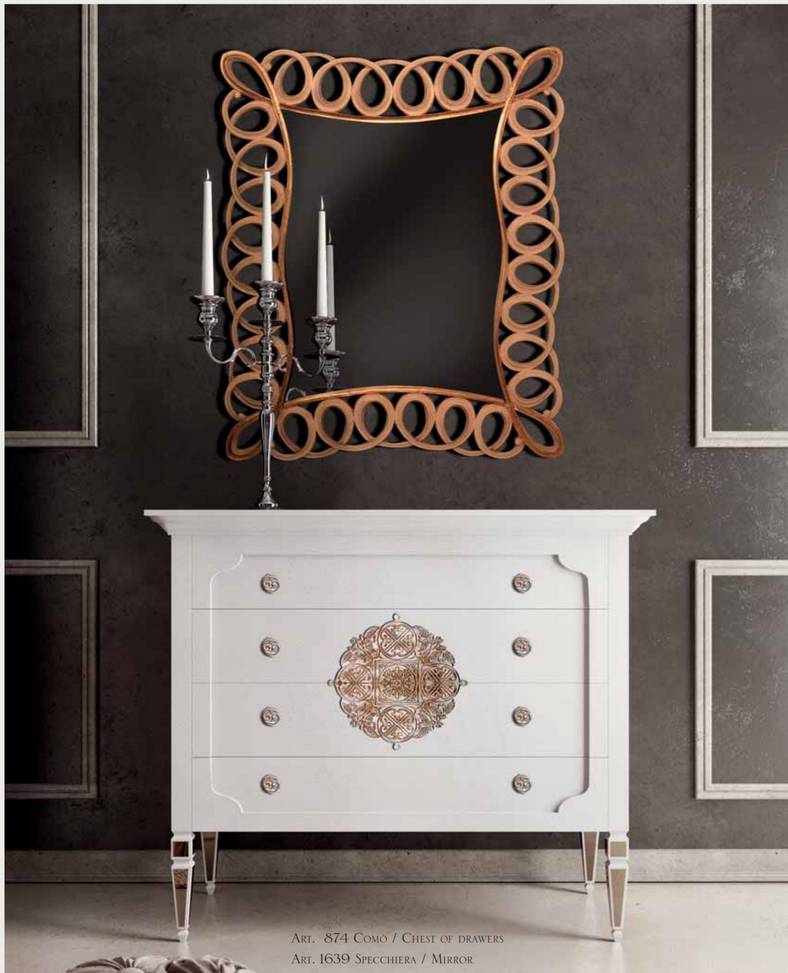
ART. 874 COMÒ / CHEST OF DRAWERS ART. 1639 SPECCHIERA / MIRROR

L'ALTA MODA PREVEDE DETTAGLI PREGIATI. THE HIGH FASHION PROVIDES VALUABLE DETAILS.