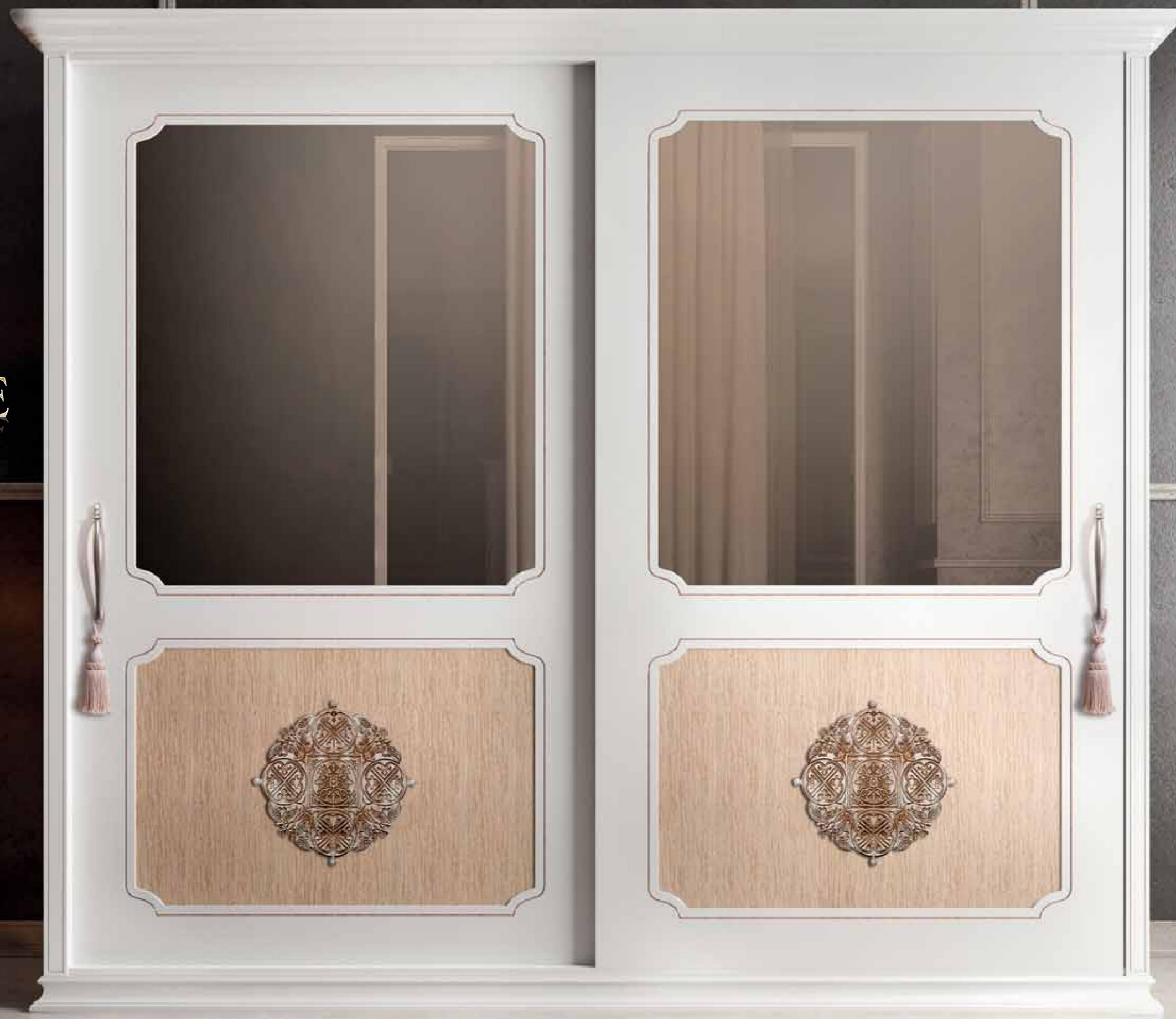
ART. 872 ARMADIO / WARDROBE

20 IL MAESTOSO ARMADIO SCORREVOLE DELLA CAMERA "VINTAGE" PROPONE L'INSERTO IN ROVERE CON LA BOZZA INTAGLIATA AL CENTRO E GLI SPECCHI SATINATI.