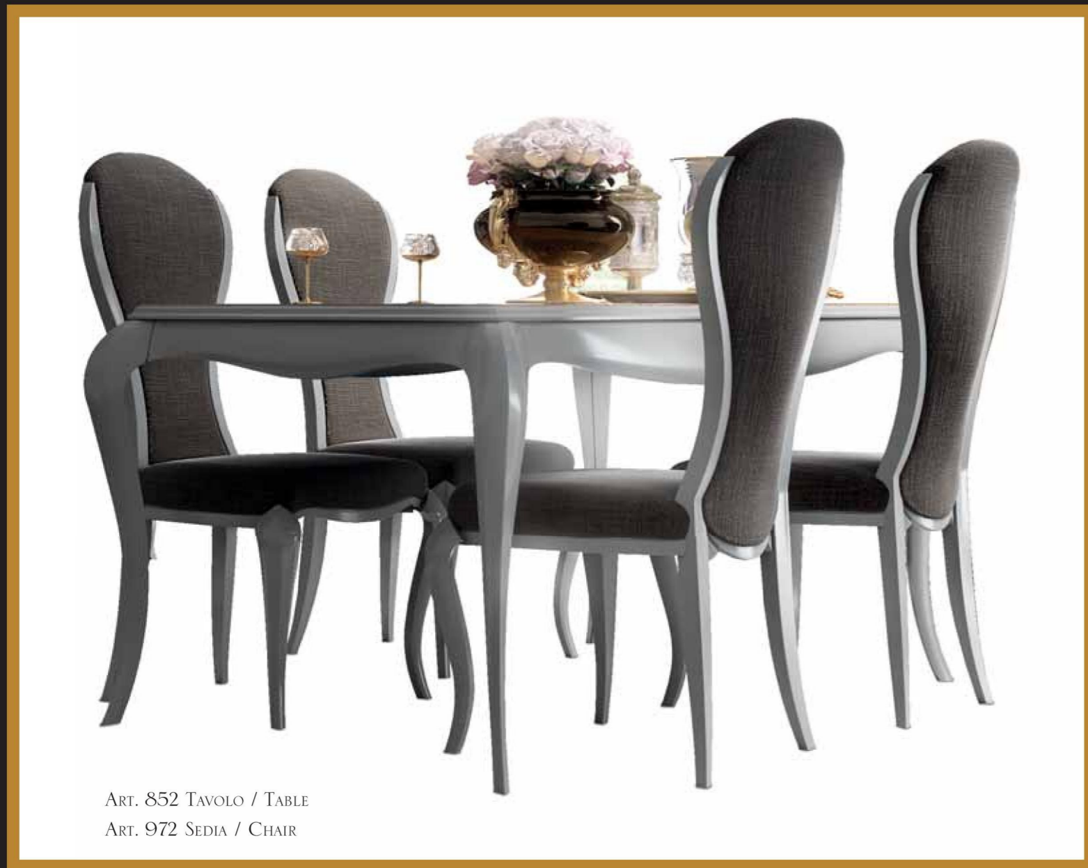
ART. 852 TAVOLO / TABLE ART. 972 SEDIA / CHAIR